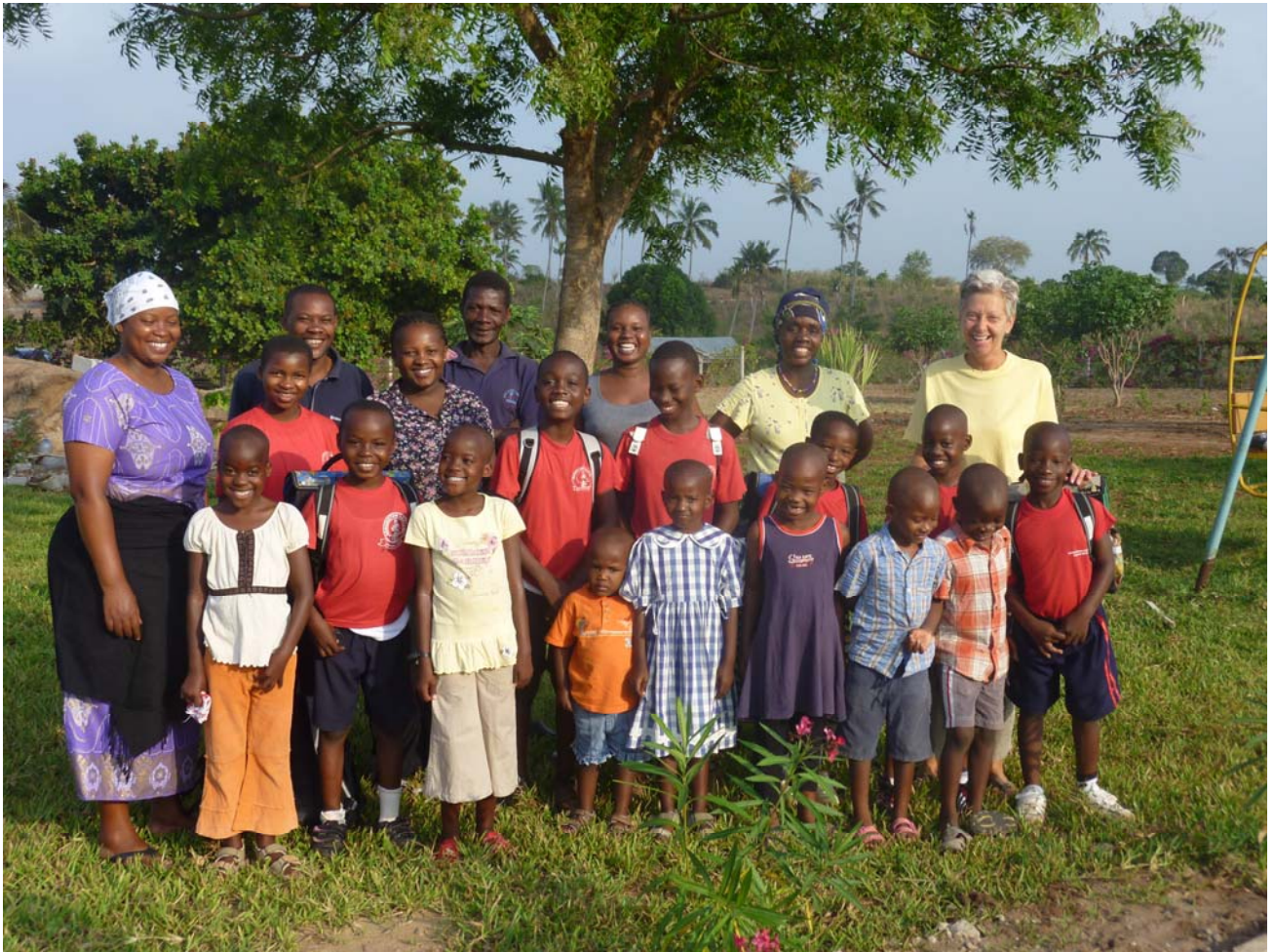
Ahsanteni sana – die Kinder danken Ihnen allen von Herzen für Ihre Grosszügigkeit!